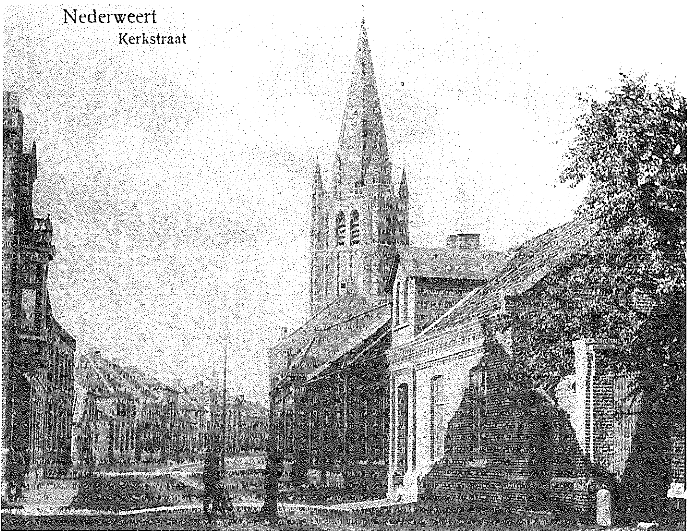
De Kerkstraat in Nederweert op een zonnige namiddag omstreeks 1915, gedomineerd door de majestueuze St. Lambertustoren.