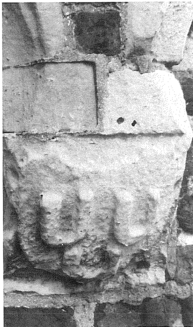
De drie hoorns uit het wapen van de graven van Horne, aangebracht in de zuidzijde van de St. Lambertustoren van Nederweert.

De voornaamste gemeentelijke bronnen van inkomsten waren de belastingen en accijnsen. Die werden ieder jaar opnieuw verpacht aan de hoogste bieder. Het meeste bracht de bieraccijns op, een heffing op het in Nederweert gebrouwen bier. De volgende drie posten geven een beeld van de verpachting daarvan. Wanneer wordt gesproken over de „genadige heer”, dan wordt de graaf van Horne (Jacob III) bedoeld.