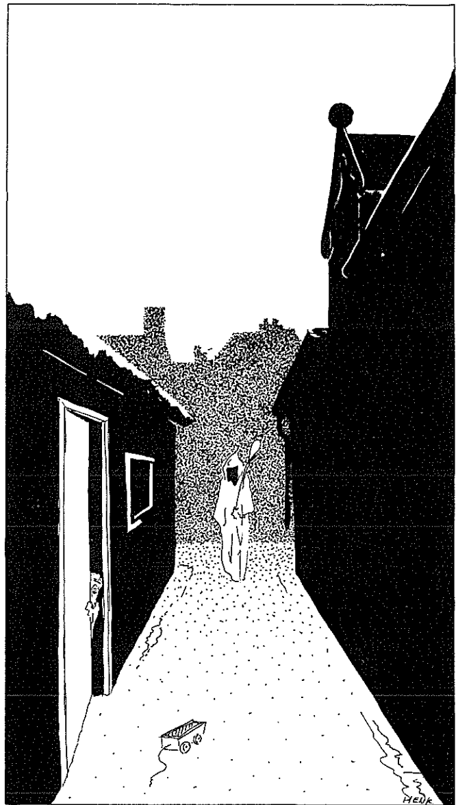
... moesten aparte kledij en een klepper dragen...

Ook in Nederweert kwam in 1518 een lepra-lidder voor (of „laezarus”) zoals hij in de gemeenterekening wordt genoemd: