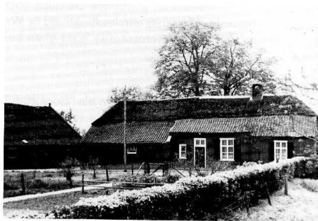
Straatgevel van Braos (oude foto).

Wanneer we akten betreffende erfenissen of boedelscheidingen van de Braosheuf lezen valt het op dat in de akten die betrekking hebben op Heindriks de naam